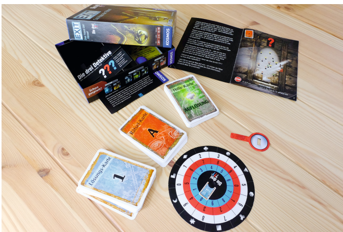
Abbildung 8: Exit-Spiel