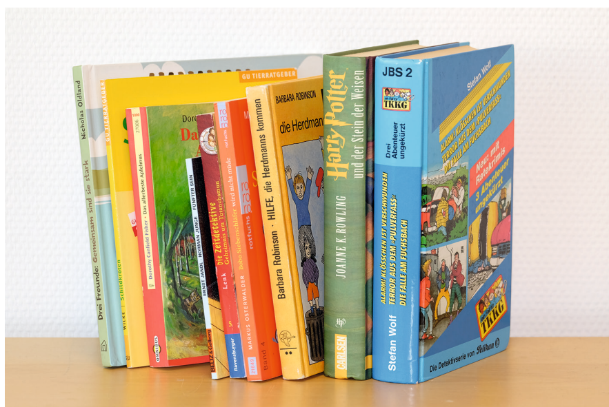
Abbildung 9: Bücher ordnen